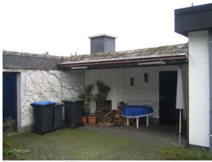
Bild 3 Vor der Aufstockung wird der bestehende Kamin bis auf die Höhe des Rohbodens demonstert.