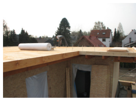
Bild 16 ...wird aufgesetzt, montiert, und