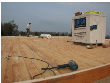
Bild 17 ...mit geeigneter Dachabdichtung und einer 120mm Aufdachdämmung versehen.