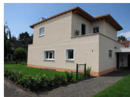
Bild 28 ...die gleichzeitig den Ansprüchen des gehobenen Standortes entgegenkommt.