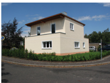
Bild 27 Das Projekt stellt eine architektonisch auffällige, moderne, Lösung dar,