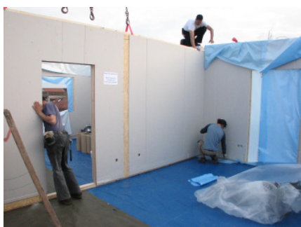
Bild 14 Da, wo notwendig, sind die Elemente zum Anschluss an die Haustechnik der Bestandsimmobilie vorbereitet.