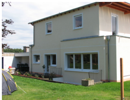
Bild 23 An der gesamten Fassade des Bestandsgebäude und der Aufstockung