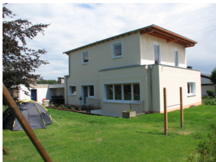
Bild 24 ...wird ein mineralisches Wärmedämmverbundsystem mit 100mm Mineralwöldämmung