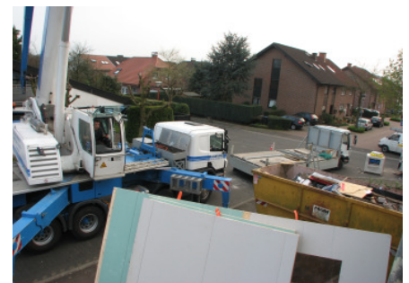
Bild 7 Mit einem speziellen Baustellenkran werden..