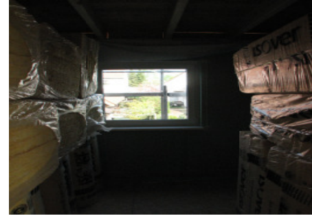
Bild 21 ...und das Markendämmmaterial fachmännisch verarbeitet werden.