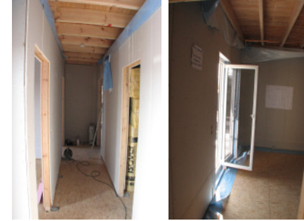
Bild 22 Kunststoffenster und -Türen mit hochwertigem Isolierglas sind eingesetzt.

Rufen Sie uns an unter +49432496 oder besuchen Sie uns im Internet auf www.avietPlus.de