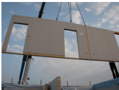
Bild 9 ...und alle Wandtafeln