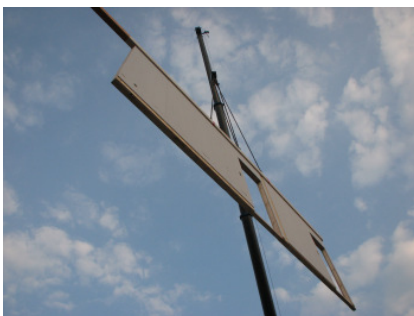
Bild 8 ...alle vorgefertigten Fassadenmodule..