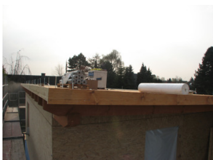
Bild 15 Das neue Geschoss-Flachdach der Aufstockung...