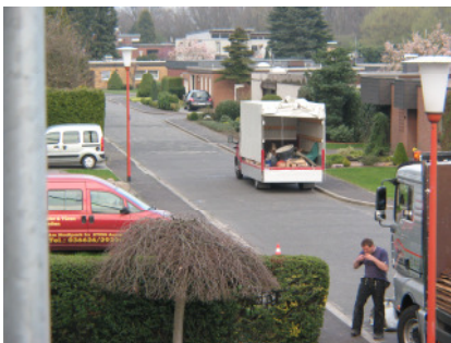
Bild 5 Sattelschlepper liefern die in der Zimmerei vorgefertigten..