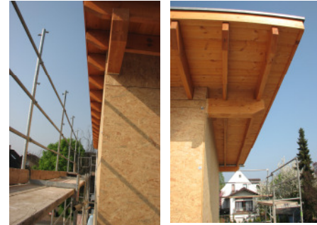
Bild 18 ...der Rohbau der Geschossaufstockung