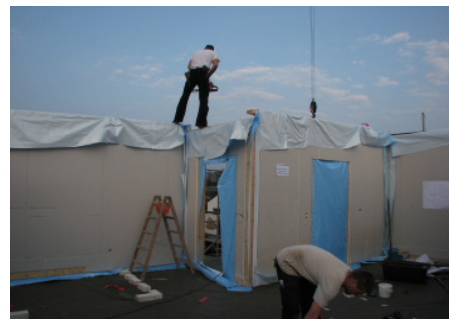
Bild 13 Alle Außenwände werden in den Anschlussbereichen mit geeignetem Quellmörtel verfüllt.