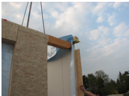
Bild 11 ...aufgesetzt, montiert und mit der vorbereiteten, zusätzlichen Geschossdecke