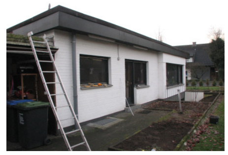
Bild 4 In der vorhandenen Holzbalkendecke wird - für den späteren Einbau einer Treppe - eine Öffnung hergestellt.