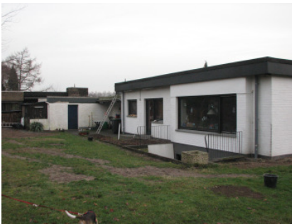
Bild 2 ...im ursprünglichen Zustand.