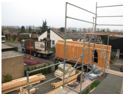
Bild 6 ....Holzbalkenlagen, Wandtafeln, Kleinteile und Materialien an.