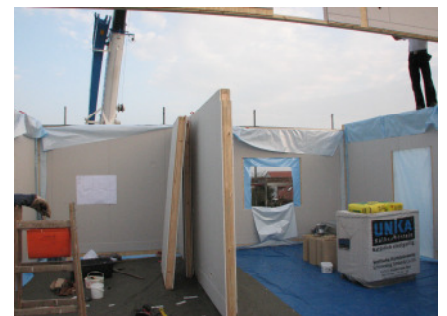
Bild 10 ...vorsichtig und nach Plan

Rufen Sie uns an unter +49432496 oder besuchen Sie uns im Internet auf www.avietPlus.de