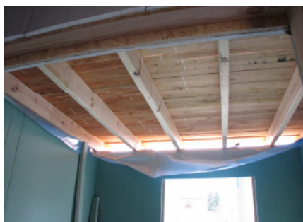
Bild 20 Der Trockenbau kann beginnen