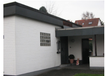
Bild 1 Der klassische Flachdach-Bungalow..

Ansprüchen der Bauherren-Familie an Raumbedarf und Komfort überein. Man wünschte eine moderne, zeitgemäße Anpassung. Unser Planungsvorschlag einer außergewöhnlichen Geschlossaufstockung gefällt und wird den aktuellen Familienbedürfnissen gerecht.