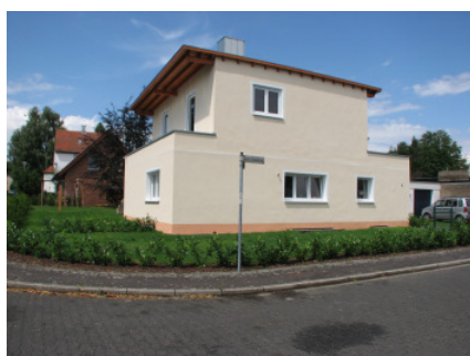
Bild 26 Im hellem Farbton erhält die Fassade eine 2mm Edelputzkörnung mit Kantenschutz und Eckprofilen